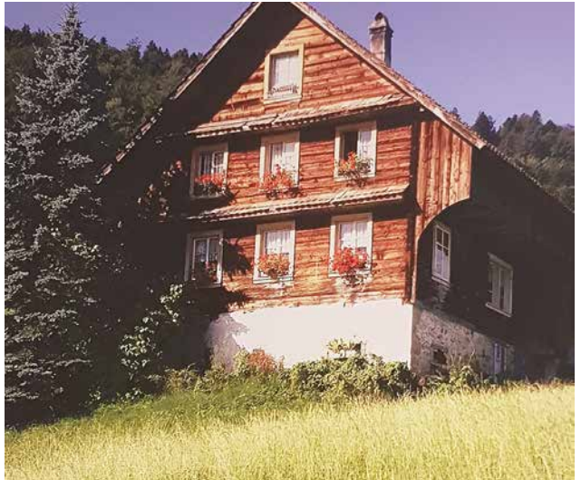
Bauernhaus im Moos, Hinterberg, aus der Fotoreihe von Raphael Ziegler im Treff 60plus

Der helle und grosszügige Raum, der von der Gemeinde kostenlos für unsere älteren Gemeindebewohner zur Verfügung steht, wird vom inzwischen gegründeten Seniorenrat Galgenen mit seinen engagierten Helferinnen und Helfer mit viel Freude und Enthusiasmus mit Leben erfüllt. Jeden Donnerstagnachmittag trifft sich eine bemerkenswerte Schar von älteren