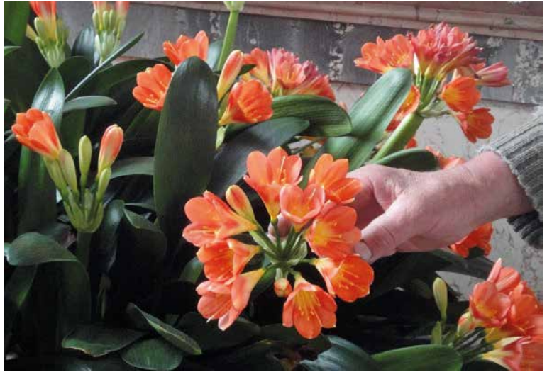
Klivia oder Riemenblatt Fam. Amaryllidaceae = Amaryllisgewächs

Ihre Heimat liegt in Eswatini (früher Swasiland) und den südafrikanischen Provinzen. Clivia gehören zu recht seit vielen Jahren zu den beliebtesten Topfpflanzen. Sie ist ausgesprochen robust, kaum krankheitsanfällig und hat nur selten „Woll- oder Schildläuse“. Wegen der dichten Belaubung ist sie auch in nicht blühendem Zustand attraktiv, zur Blüte aber eine bemerkenswerte Augenweide! Der Name Riemenblatt weist auf die 6 cm breiten Blätter hin. Die Vermehrung erfolgt durch Abtrennung von Kindeln (ganze Triebe), eher selten mit Samen.