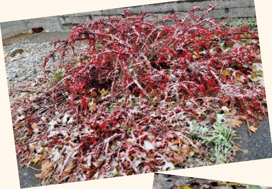
Winterblüten und -beeren,