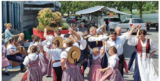
Erwachsene mit Junioren, Beerimärt Lachen – Juli 2023