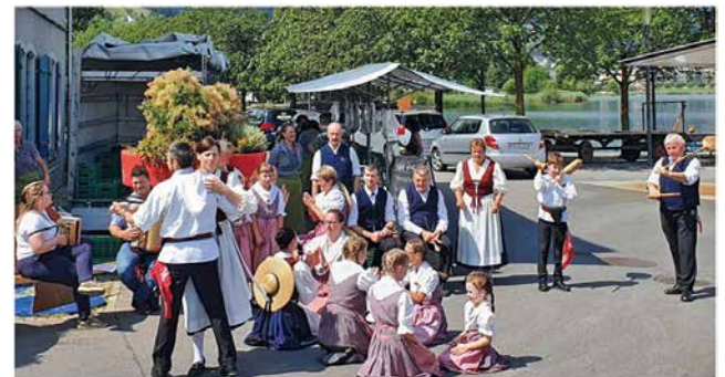
Erwachsene mit Junioren, Beerimärt Lachen – Juli 2023