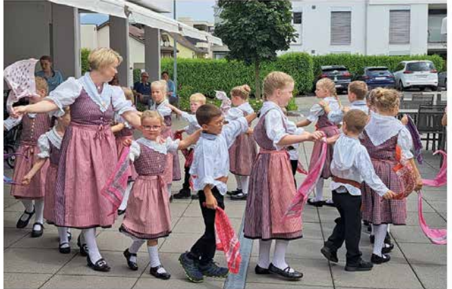
Auftritt Kindertanzgruppe – Juni 2023

Auch die Sennenhilbi Innerthal oder den Erntedank-Gottesdienst in Galgenen gehören fest in unser Jahresprogramm.