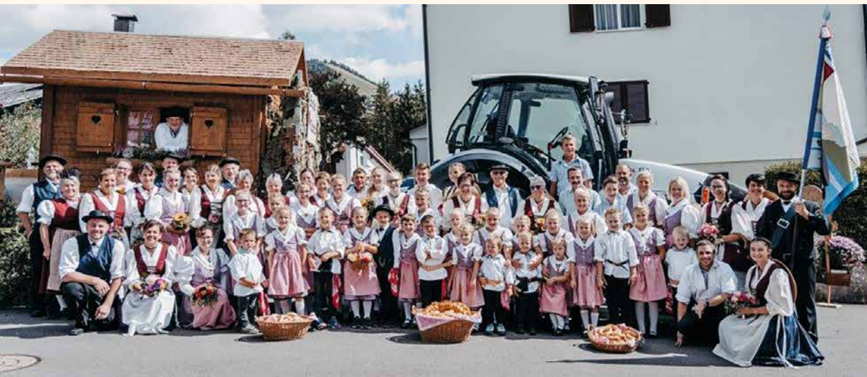
Äplerchilbi 2022